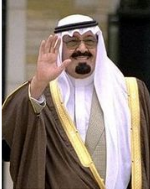
King Abdullah bin Abdul Aziz al-Saud