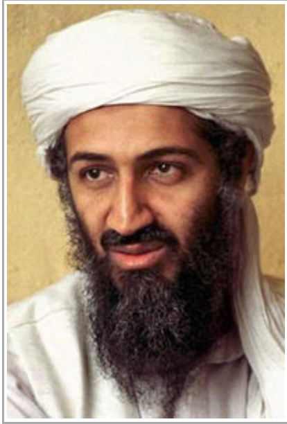
Islam's Most Decorated